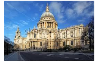
St. Paul dómkirkja